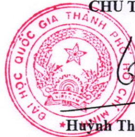
*Huỳnh Thành Đạt